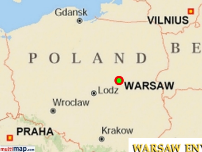
WARSAW ENVIRONS 1940 0 2 MILES